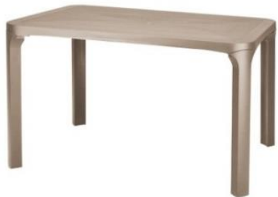
OS. EN Rechteck