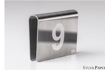
HAR.MONIE Nummerierung schraubbar