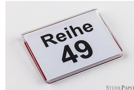
Reihennummerierung zum Aufkleben